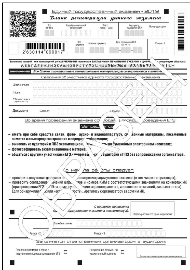
Рис 17. Бланк регистрации устного экзамена

Бланк регистрации устного экзамена заполняется так же, как обычный бланк регистрации (см. п. 3.3). В поле «Номер аудитории» указывается номер аудитории проведения устного экзамена. Служебные поля «Резерв-1», «Резерв-2» и «Резерв-3» не заполняются.